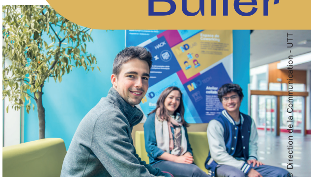
Direction de la Communication - UTT